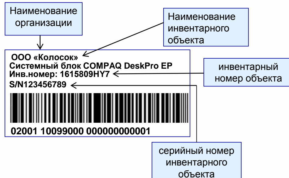
Рис.1 Этикетка местонахождения инвентарного объекта Рис.2 Этикетка инвентарного объекта

Верификация базы данных учета инвентарных объектов в части информации о текущем состоянии объектов инвентаризации, загруженной из ТСД, и актуализация базы данных учета инвентарных объектов; Формирование отчетности по базе данных учета инвентарных объектов, инвентаризационных описей по материально ответственным лицам.